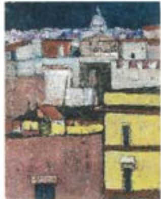
青木達也「アームのある風景」1966年