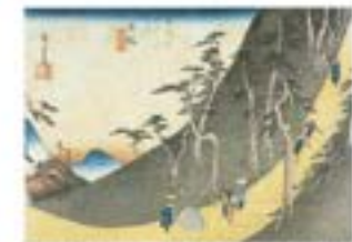
歌川広重「東海道五十三次之内 日根(保永堂版)」