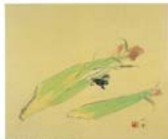
竹内栖鳳「秋の実り」