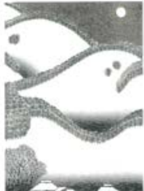
牧野宗則「雪山轟光」1981年