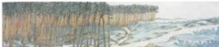
逢水御舟「赤城路の巻」