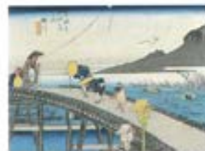
歌川広重「東海道五十三次之内 掛川(保永堂版)」