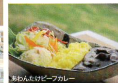
あわんたけびーカレー