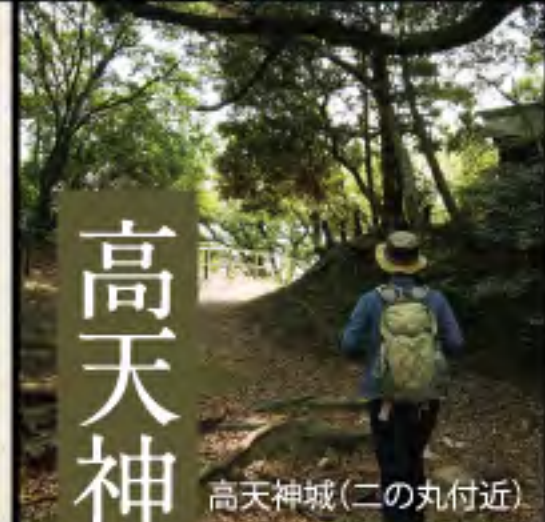
高天神城(二の丸付近)