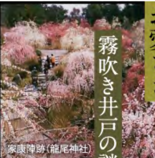
家康陣跡(龍尾神社)